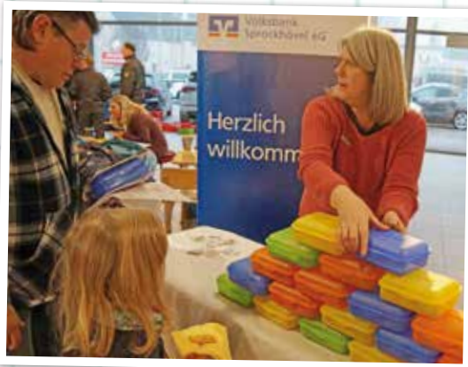
Brottdose in passender Farbe zum neuen Tornister? Die Volksbank hielt eine große Auswahl kostenfrei parat.

präsentierten sich gemeinsam mit Lern-, Informations- und Spielstationen den Kleinen und den Großen. Mit dabei waren unter anderem die Volksbank Sprockhövel die kostenlos Brottdosen für den neuen Rucksack verteilte, und die Ergotherapie Fantasia, wo die Kids unter professioneller Anleitung schonmal die richtige Stifthandhabung ausprobieren konnten.