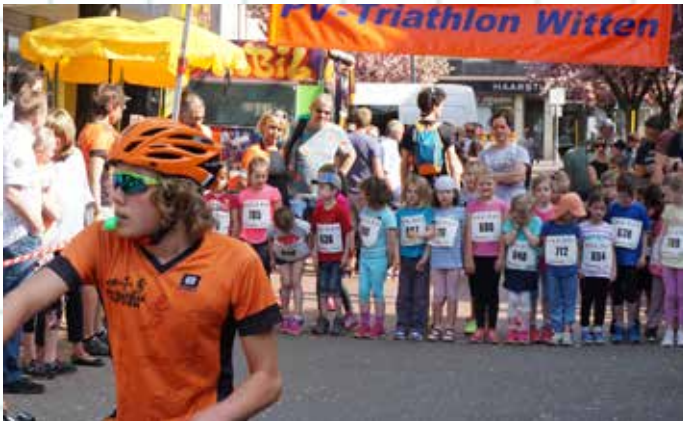
An den Start: Der Kinderlauf bei den Kindertagen 2018, organisiert vom PV-Triathlon Witten.