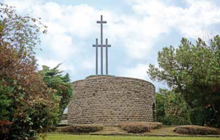
Das Ehrenmal. Ein selten zu genießender Anblick.