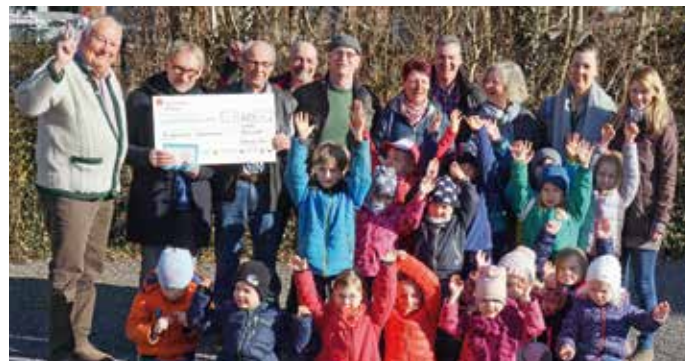
Die Empfänger bedankten sich persönlich bei den Spendern.