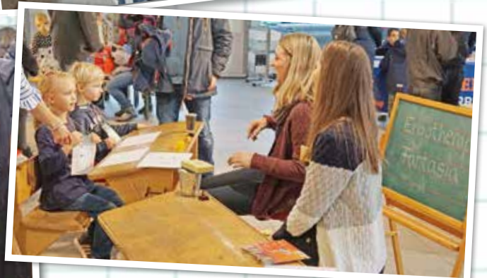
Die korrekte Stifthandhabung unter professioneller Anleitung im „kleinen Klassenzimmer“ der Ergotherapie Fantasia.