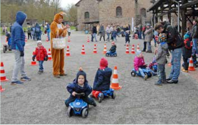
☞ Besser zu früh als zu spät: Der Osterhase verteilte auf Zeche Nachtigall Eier an die Kinder.