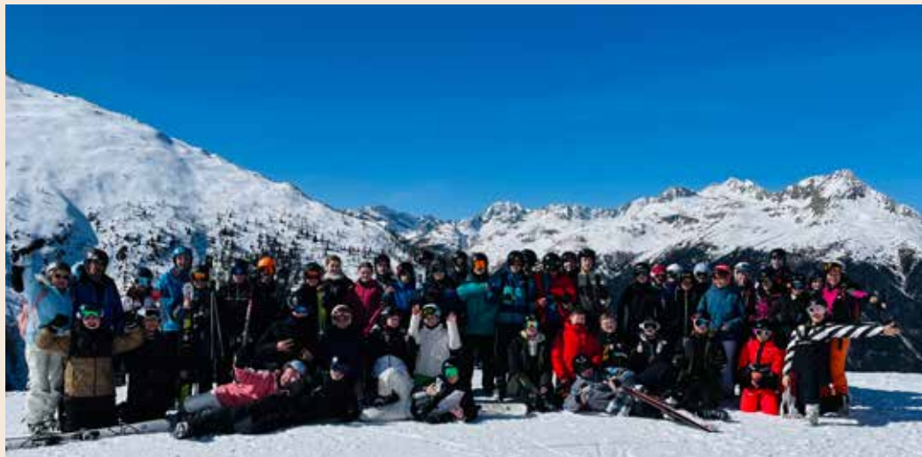
☞ Jede Menge Schnee gab es bei der Belohnungsfahrt für die Hardenstein-Urlauber.