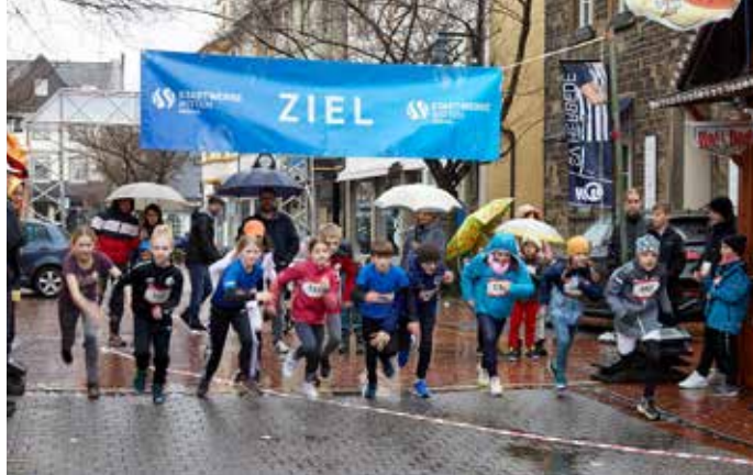
Trotz Regen waren rund 50 Kinder am Start