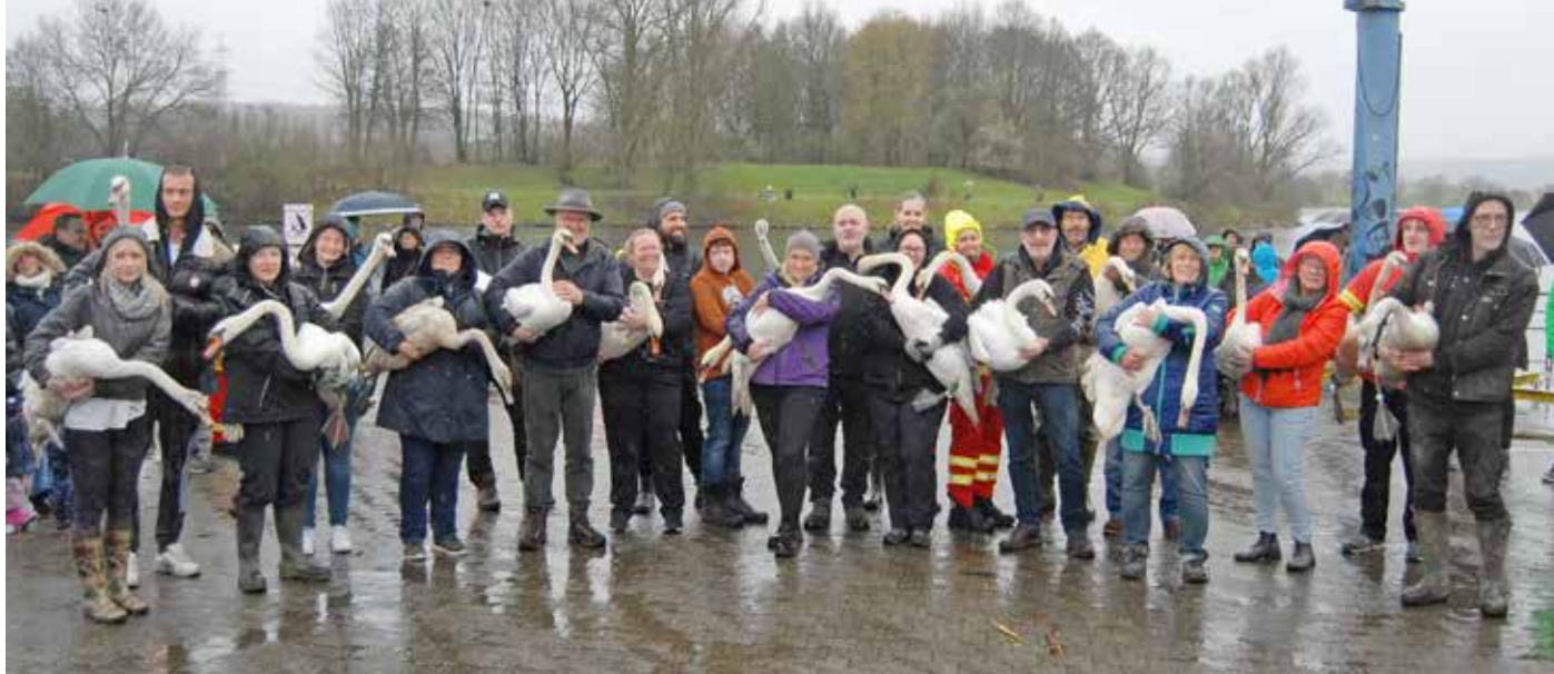
22 Schwäne wurden am Kemnader See wieder in die Freiheit entlassen.