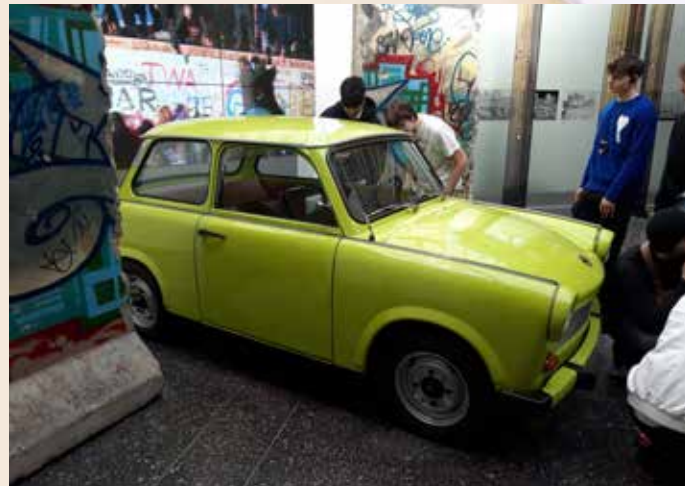
☞ Ein informativer Ausflug ins Haus der Geschichte stand für die Abiturienten in spe an.