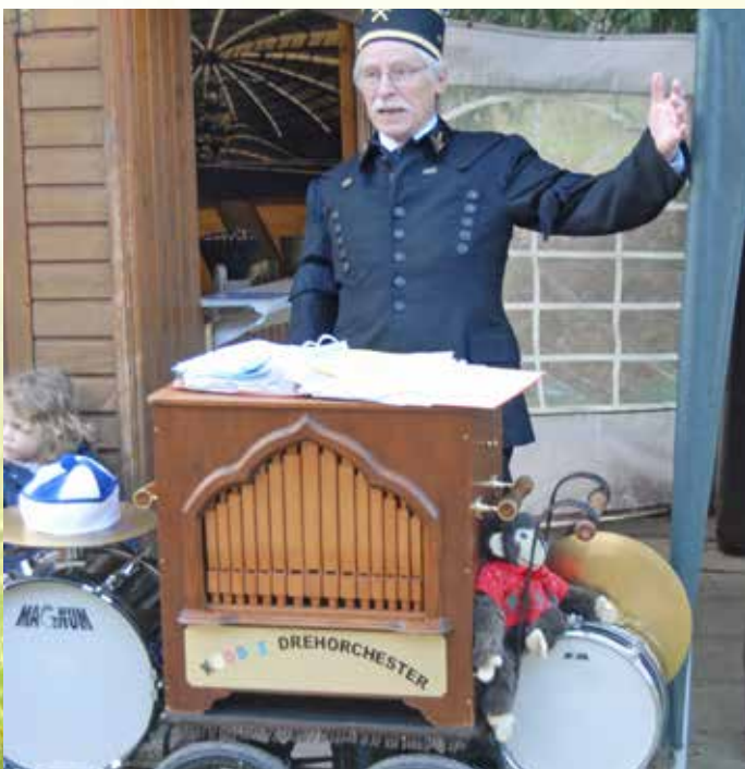
☞ Zechenromantik mit Drehorgelspieler gab es auf Herberholz.

Kaputt ging auch was, und zwar die Bimmelbahn, die Besucher vom Parkplatz Nachtigall durchs Muttental kutschierte. Aufgrund eines technischen Defekts blieb die Bahn am Nachmittag liegen, konnte aber nach anderthalbstündiger Reparatur den Fahrbetrieb wieder aufnehmen.